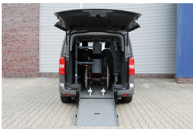
Personen- & Rollstuhlrückhaltesystem, Kopf- & Rückenstütze FutureSafe

Heckausschnitt mit ein- /ausklappbarer Rampe mit EasyUse Funktion, PROTEKTOR Personen- & Rollstuhlrückhaltesystem (DIN und ISO geprüft)