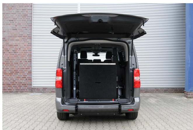
Gute Sicht nach hinten trotz aufgestellter Rampe

Produkt Empfehlung Nummer RP-DE-3-606-K0-626-OP