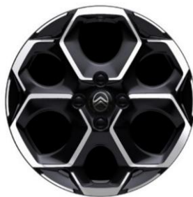
17-Zoll-Leichtmetallfelgen Atacamite mit Diamantschliff