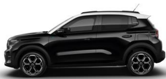
Perla Nera Schwarz (M)