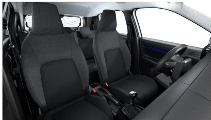
Ambiente YOU - Stoff Schwarz/Grau