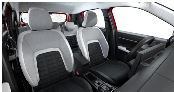
Ambiente METROPOLITAN GREY - Stoff-/Kunstlederbezug Metropolitan Grey