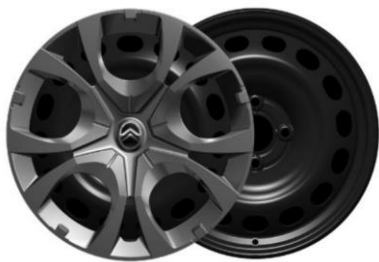
16-Zoll-Stahlfelgen mit Radzierkappen Pyrite in Mattschwarz